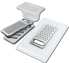
Kit râpes avec anneau de support et cuvette 8159 101 * uniquement en combinaison avec l'accessoire 8644 101